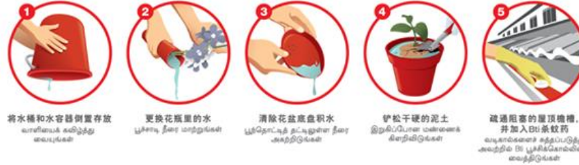
1 將水桶和水容器倒置存放 வாய்ப்பாக கண்டுபிடித்து எய்யுங்கள்

நம் குடும்பத்தினரையும் அக்கம்பக்கத்தினரையும் பாதுகாக்க வீடுகளில் தேங்கியுள்ள நீரை அகற்றிடுவோம்: