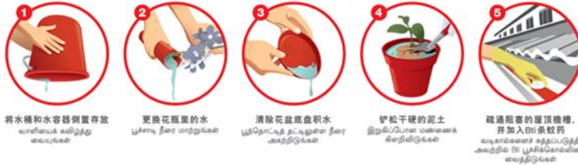
1 將水桶和水容器倒置存放 வாய்ப்பாக கண்டுபிடித்து எய்யுங்கள்

நம் குடும்பத்தினரையும் அக்கம்பக்கத்தினரையும் பாதுகாக்க வீடுகளில் தேங்கியுள்ள நீரை அகற்றிடுவோம்: